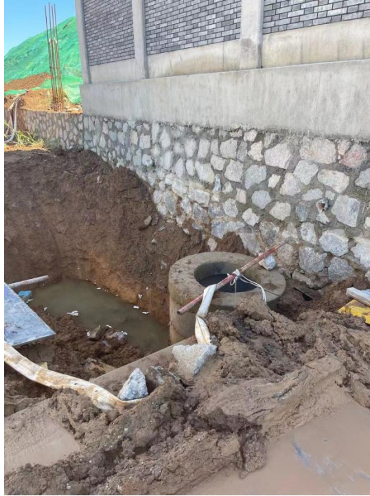
图 3-4 临时措施照片